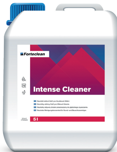
Forteclean Intense Cleaner 5 l

Chraňte před mrazem. Skladujte v chladu a suchu. Uchovávejte uzamčený a mimo dosah dětí.